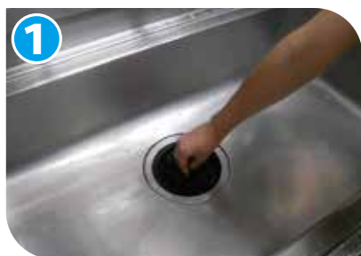
目皿のゴミ等を取り除きます。