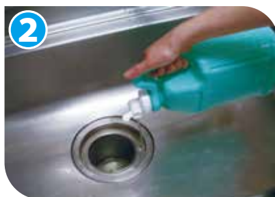
原液を排水口に流し込み、約10分間放置します。(長時間放置しないでください。) ※詰まり防止には、毎日 2秒 /回注ぐ。 (40～60mL)